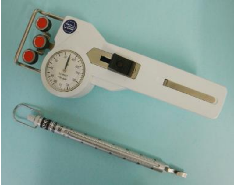
Abbildung 5: Fadenspannungsmessgerät und Federwaage zur Überprüfung der Fadenspannungen an der Nähmaschine

Hat man die beiden Einflußgrößen Stoff und Fadenspannung im Griff, wird sich schnell eine perfekte Produktqualität - einschließlich schöner Nahtoptik nach der Wäsche – bei Easy Care-Berufsbekleidung einstellen. Warum sollte hier nicht gelingen, was andere Konfektionsbereiche bereits seit langem vormachen?