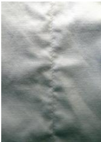
Abbildung 4: Gekräuselte Nahtoptik nach der Wäsche durch zu hohe Fadenspannung

Die Versuchsreihe mit der erhöhten Fadenspannung erhält bei allen Gewebemustern sowohl vor als auch nach der Wäsche eine um mindestens eine Note schlechtere Bewertung im Vergleich zur Versuchsreihe mit idealen Nähbedingungen. Bei empfindlichen Gewebemustern führte die hohe Fadenspannung sogar zu einer Verschlechterung um 2,5 Noten. Sechs der acht mit zu hoher Fadenspannung gefertigten Gewebemuster erreichten nach der Wäsche nicht die Note SS3. Das heißt eine zu hohe Fadenspannung verursacht in dem ohnehin sensiblen Produktbereich „Easy Care“ in jedem Fall eine unakzeptable Nahtqualität. Abbildung 4 verdeutlicht visuell den katastrophalen Nahtausfall.