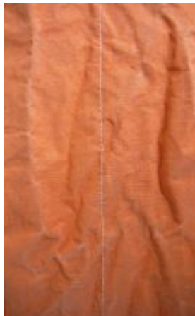
Abbildung 1 Unakzeptable Nahtoptik nach der Wäsche (keine Bewertung nach dem Qualitätsstandard 702 möglich)

Unerwartet für alle Beteiligten fielen 8 der 16 untersuchten Artikel bei der Bewertung raus. Ihr Erscheinungsbild nach der Wäsche war für eine Beurteilung zu schlecht. Die Gewebestreifen waren extrem stark geknittert und wellig (siehe Abb. 1). Eine Beurteilung der Nähte war hier nicht möglich und hätte auch wenig Sinn gemacht. Dieses Ergebnis bestätigte einmal mehr, dass nicht alle Easy Care-Artikel auch tatsächlich diese Produktauszeichnung verdienen.